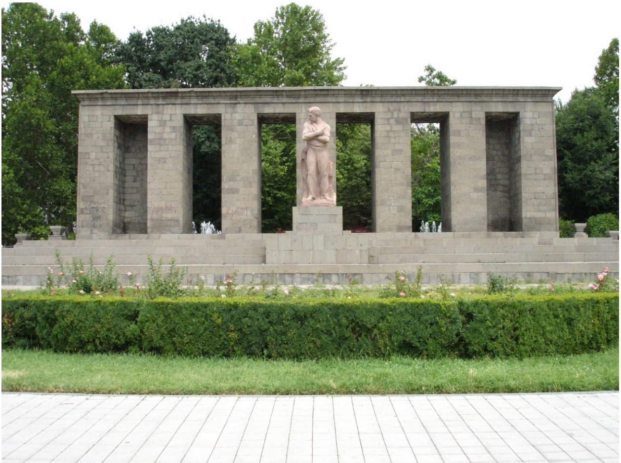
Сергей Меркуров. Памятник Степану Шаумяну. Ереван, 1931

В 1911 году С. Г. Шаумян основал в Баку марксистский журнал «Современная жизнь».